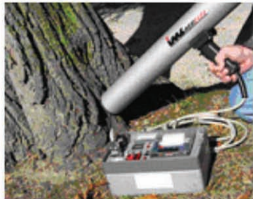
Indagine di stabilità V.T.A (Visual Tree Assessment) su alcuni soggetti arborei