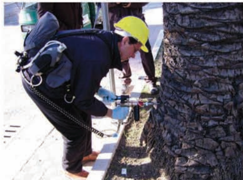
Interventi di endoterapia su esemplari di Phoenix Canariensis per la prevenzione del Punteruolo Rosso (Rhyncofhorus ferrugineus)