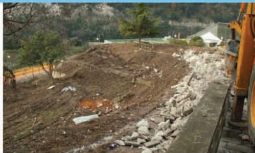
demolizione delle vecchie strutture esistenti