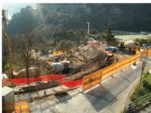
fasi di realizzazione delle strutture in c.a.