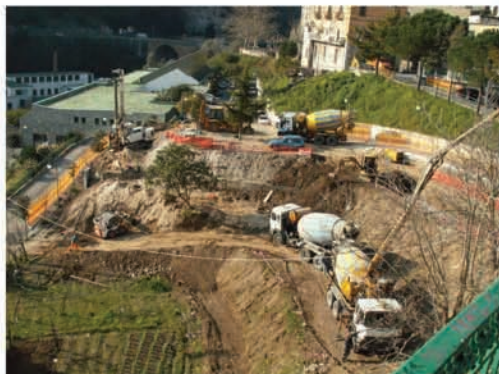
veduta del cantiere dalla piazza