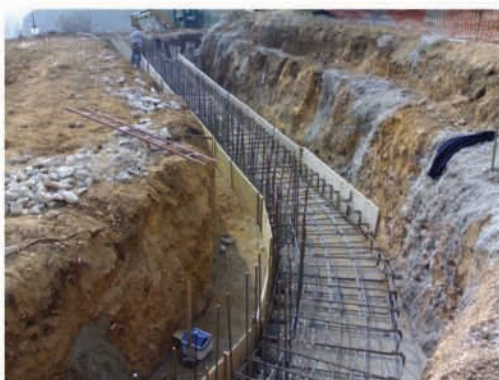
Fasi di realizzazione delle opere