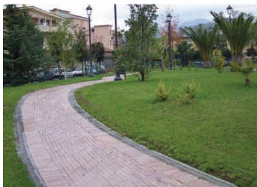
I percorsi all'interno del Parco si snodano attraverso le varie essenze arboree ed arbustive