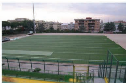
collocazione delle strisce bianche del campo