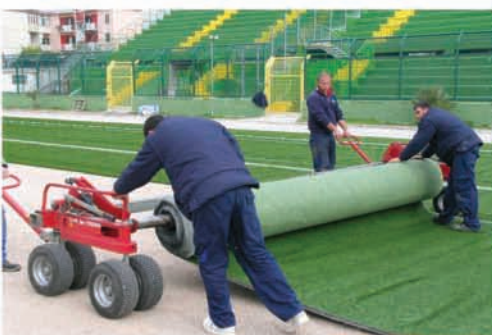
Stesura del manto di gioco