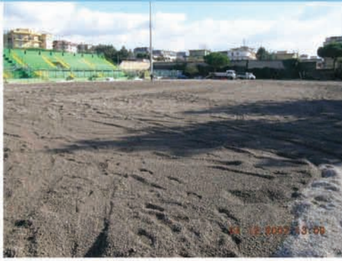
Stesura del sottofondo